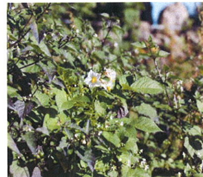
Nattskatta och potatis hör inte ihop. Delad bekämpning med Boxer har bra effekt. (Observera att fotot är taget utanför fältet!)

– Kristianstadsbygden är ett tungt rotfruktsområde med hård konkurrens om odlarna. Kan bara Lyckeby hänga med i utvecklingen så är jag lugn!