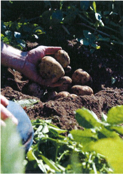
Stärkelsepotatis ska hanteras med varsam hand.