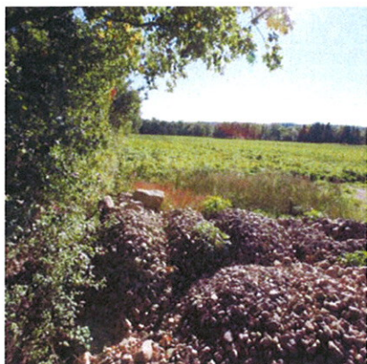
Här ska stenen ligga. Inte på upptagaren!

– Jag har inget klimatspjut eller liknande utan går på en allmän bedöm-